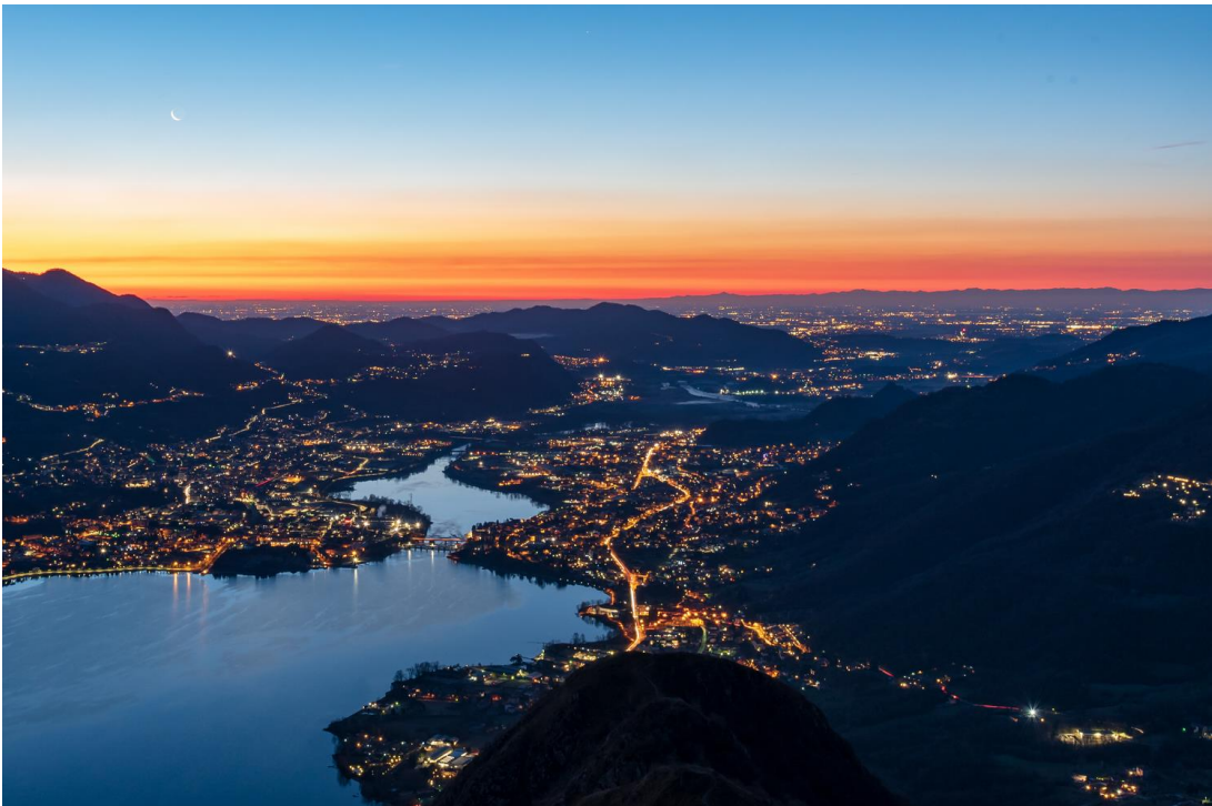
Secondo classificato “Alba al Barro” Gabriele Sala – Triuggio