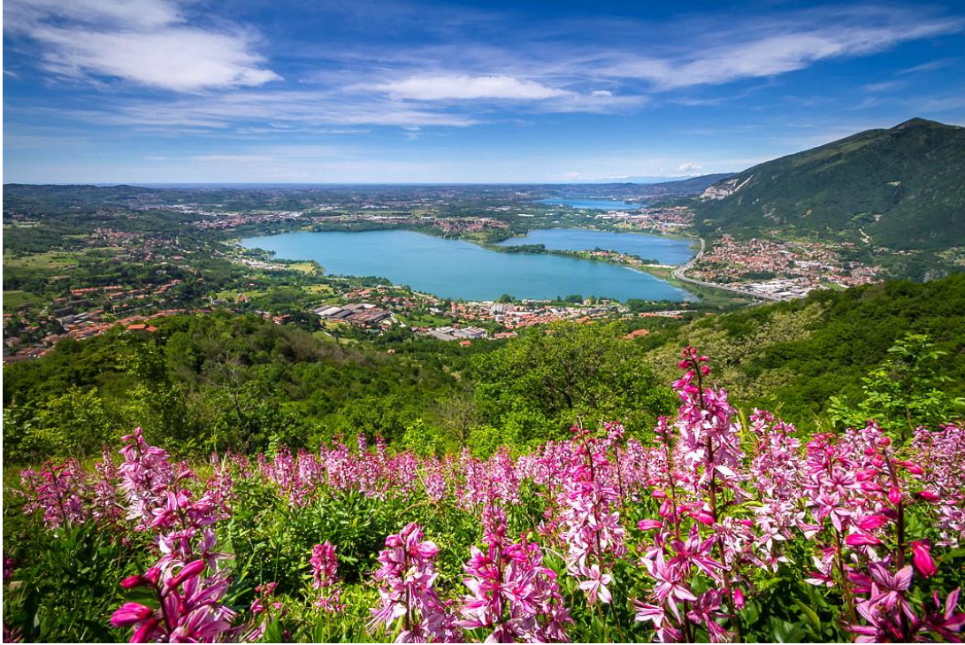
Primo classificato “Rosso dominante” Pio Rota – Almenno San Bartolomeo