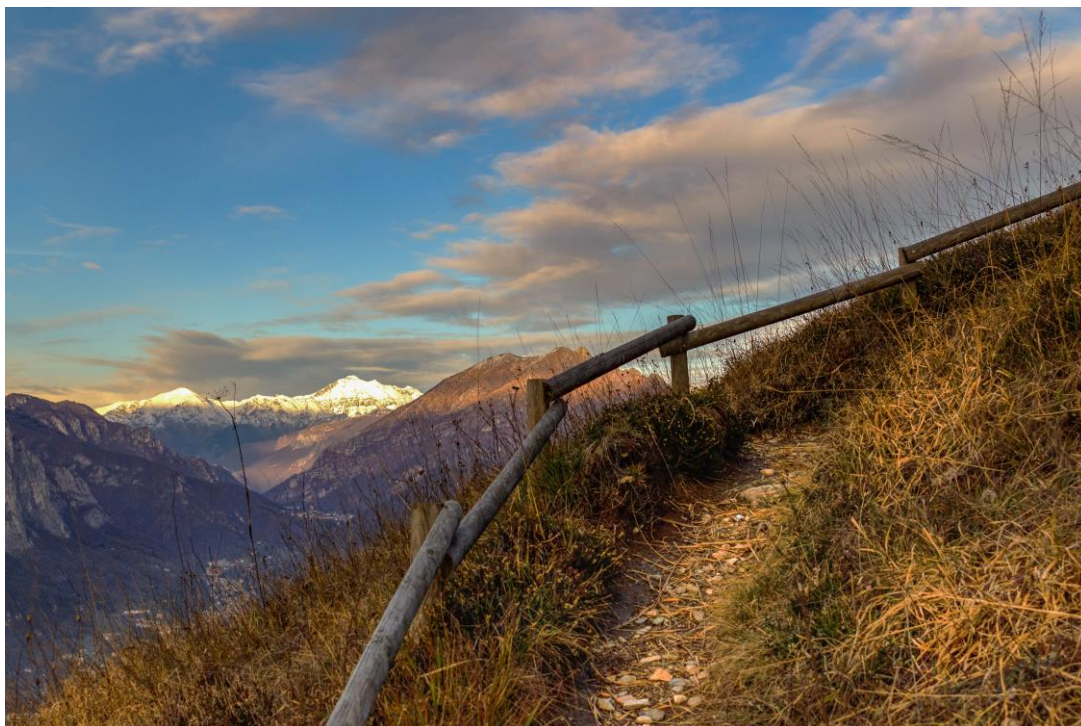
“Il sentiero dei fiori”