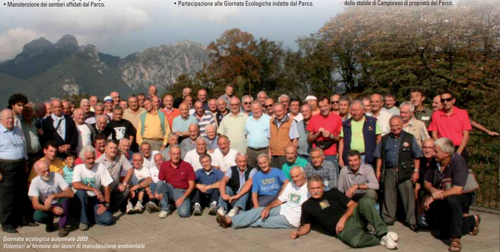
Giornata ecologica autunnale 2009 Volontari al termine dei lavori di manutenzione ambientale