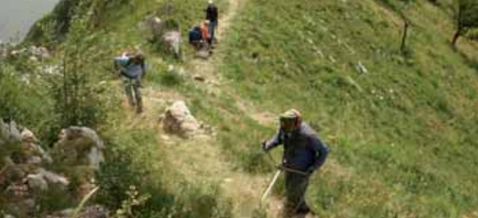
Intervento di manutenzione dei sentieri del Barro